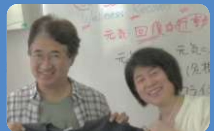
まこちゃん えつこむ